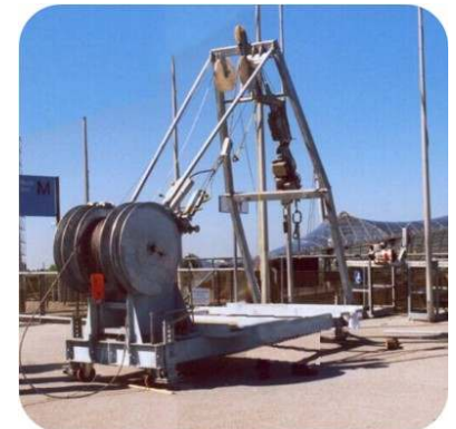
Mobile Windeneinheit für Trag- Arbeits- und Zugseil Mobile hoist unit for carrying, working and hauling cable