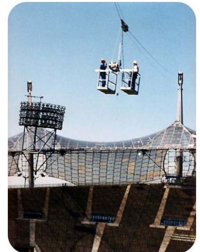
Mobile, für alle kritischen Dachbereiche geeignete Befahranlage mit integriertem Antrieb und Energieversorgung Mobile one, for all critical roof ranges suitable elevator with integrated drive and power supply